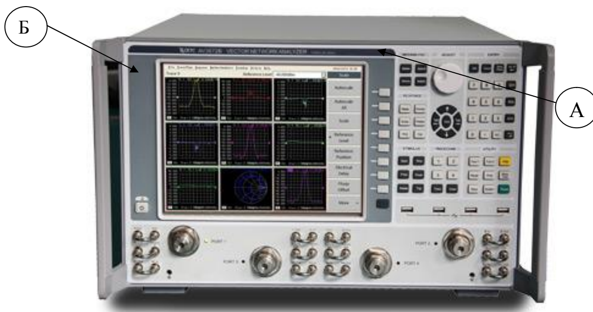
А) Место для размещения знака утверждения типа Б) Место для размещения знака поверки Рисунок 1 - Общий вид анализаторов. Вид спереди